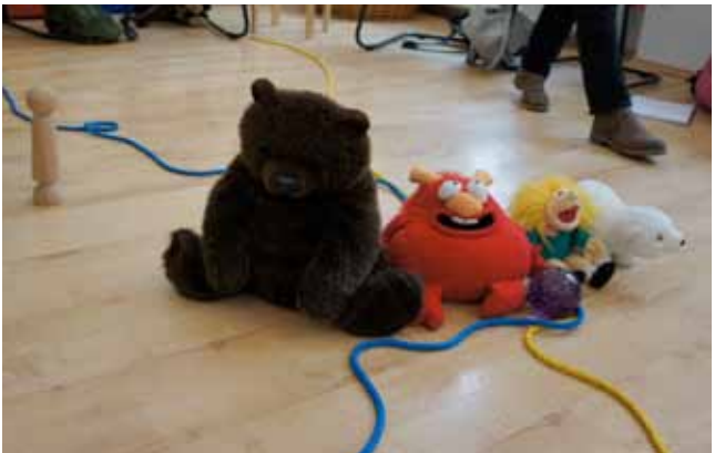
Skulpturarbeit am Lebensfluss

Mit Hilfe des Lebensflusses-Modells können die Mitglieder einer Familie/ eines Systems sich ziel- und lösungsorientiert mit der zu gestaltenden Zukunft auseinandersetzen und mögliche Visionen erspüren, als Haltung einnehmen und damit ihre Lösungshoffnung konkretisieren und stärken.