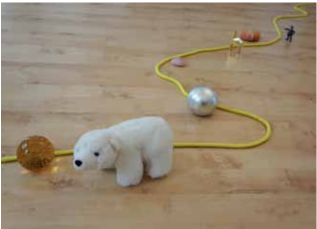
Lebensflussarbeit mit verschiedenen Materialien.

Die Weiterbildungen sind selbstverständlich von den systemischen Dachverbänden DGSF und DGSP anerkannt und zertifiziert. Einige Veranstaltungen sind von der Bayrischen Psychotherapeutenkammer bepunktet!