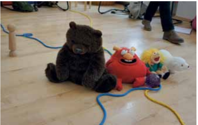
Skulpturarbeit am Lebensfluss

Mit Hilfe des Lebensflusses-Modells können die Mitglieder einer Familie/ eines Systems sich ziel- und lösungsorientiert mit der zu gestaltenden Zukunft auseinandersetzen und mögliche Visionen erspüren, als Haltung einnehmen und damit ihre Lösungshoffnung konkretisieren und stärken.